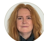
ALISON MACKEY AUTHOR AND PROFESSOR OF LINGUISTICS AT GEORGETOWN UNIVERSITY

Students from 6th to 11th grade have Portuguese classes every other day for 80 minutes. In 12th grade, the 80-minute classes take place every day for one semester. The regular Portuguese program is offered to students who are proficient in Portuguese, and focuses on composition, language reflection and literature. For Portuguese language learners (PLL), these classes focus on language acquisition as an instrument for social interaction between students from different origins who speak other languages, as well as broadening cultural perspectives through language.